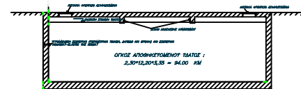
ΤΟΜΗ ΣΤΟΝ ΑΞΟΝΑ "Τ-Τ"