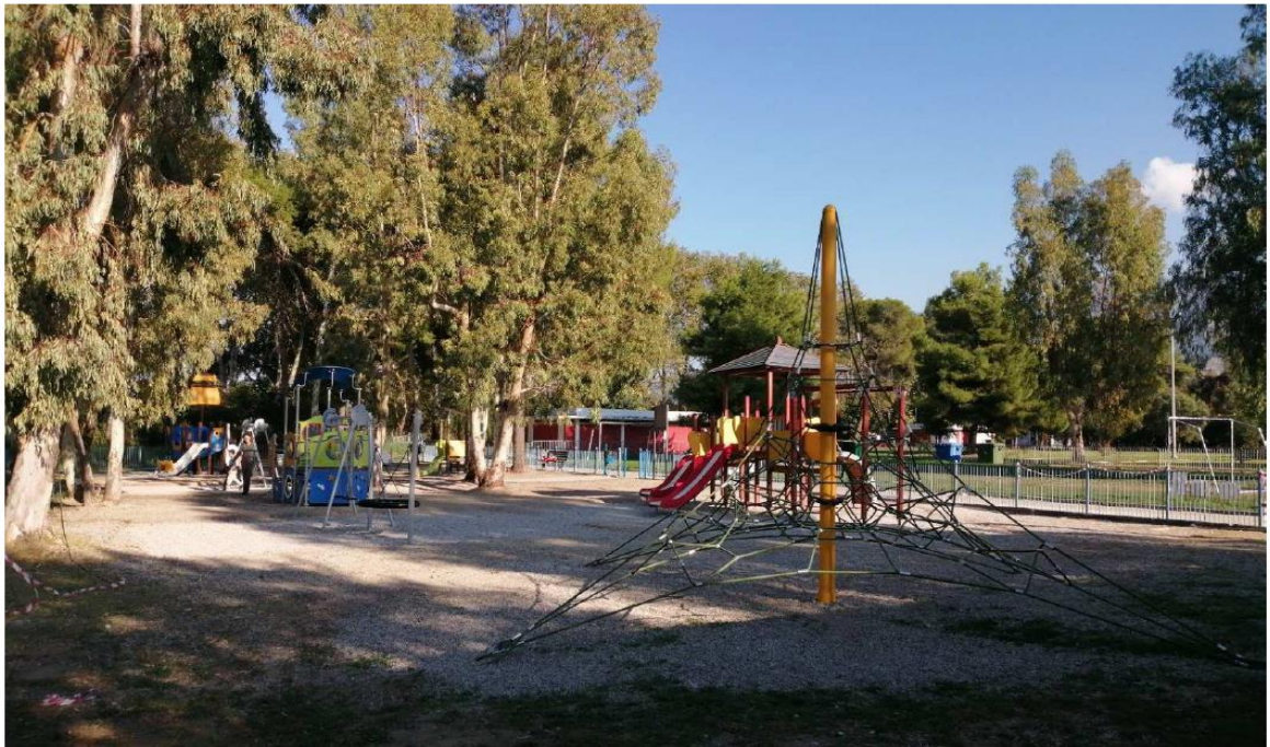
Πιστοποιημένη παιδική χαρά