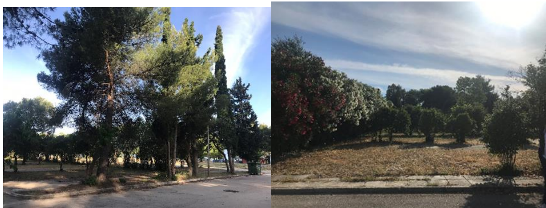
Προβλεπόμενη θέση ανοικτού θεάτρου

Το IROKO είναι ξύλο κατάλληλο για κατασκευές εξωτερικού χώρου, και για περιοχές με μεγάλη υγρασία ή κοντά σε θάλασσα. Επίσης, είναι ιδιαίτερα ανθεκτικό στην υγρασία και ευμετάβλητο στο φως. Τα ιδιαίτερα χαρακτηριστικά της είναι η μεγάλη αντοχή στις καιρικές συνθήκες λόγω της μεγάλης πυκνότητας των ιστών και πολλές φορές δεν απαιτείται προστασία από βερνίκια. Το αρχικό του χρώμα είναι ανοιχτό καφέ που μεταβάλλεται σε λίγο σε πιο σκούρο καφέ με χρυσίζουσα απόχρωση. Είναι ξύλο αντοχής με πολύ καλές μηχανικές ιδιότητες.