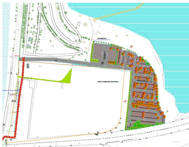
Πρόταση αρχιτεκτονικής διαμόρφωσης του χώρου στάθμευσης

Ο χώρος αυτός θα εξασφαλίσει συνολικά 174 θέσεις για Ι.Χ., 56 θέσεις για δίκυκλα, και 12 θέσεις για λεωφορεία. Το υλικό που θα χρησιμοποιηθεί για την επίστρωση θα είναι τσιμεντοκυβόλιθοι ψυχροί, χρώματος γκρι 10x10x8 εκ., με επίπεδη επιφάνεια και ψαθωτή τοποθέτηση. Η οριοθέτηση των θέσεων στάθμευσης οχημάτων θα γίνει με ίδιου τύπου τσιμεντοκυβόλιθους χρώματος κεραμιδί. Επίσης θα φυτευτούν 170 δένδρα περίπου.