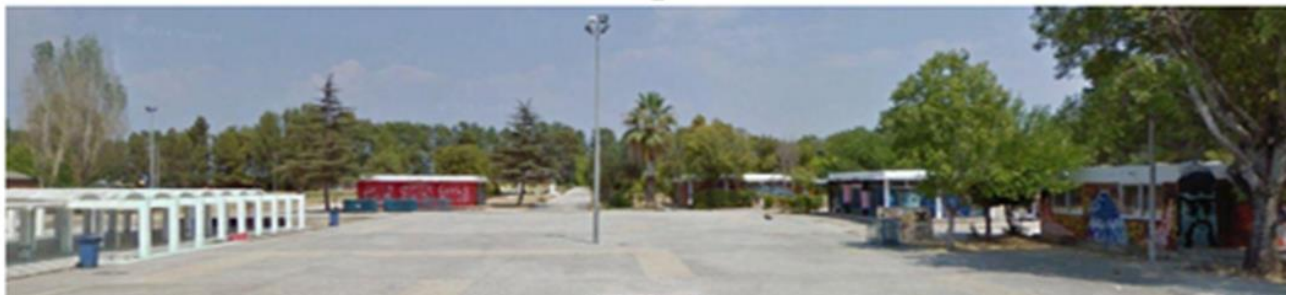
Χώρος αθλητικών δραστηριοτήτων μαζί με υπόστεγο και βοηθητικά κτίρια

Σήμερα, ο χώρος αυτός λειτουργεί ως Πάρκο Εκπαιδευτικών Δράσεων του Δήμου Πατρέων και Κέντρο Δημιουργικής Απασχόλησης Παιδιών. Συγκεκριμένα, ο χώρος αυτός έχει εμβαδό περίπου 54 στρέμματα και αποτελείται από μικρά κτίρια με διάφορες χρήσης (όπως γραφεία, μαγειρεία, αποθήκες, WC, γραφεία ιστιοπλοϊκός, εστιατόριο-καφέ, χώρος εκδηλώσεων, και στέγαστρα. Επίσης, υπάρχουν δυο γήπεδα μπάσκετ με κερκίδες, beach volley, πιστοποιημένη παιδική χαρά, χώρος ποδοσφαίρου, χώρος στάθμευσης και παρτέρια.