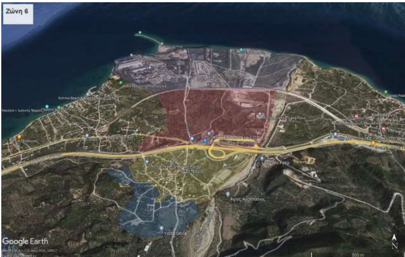
Εικόνα 4: Ζώνη 6 (Δρέπανο)