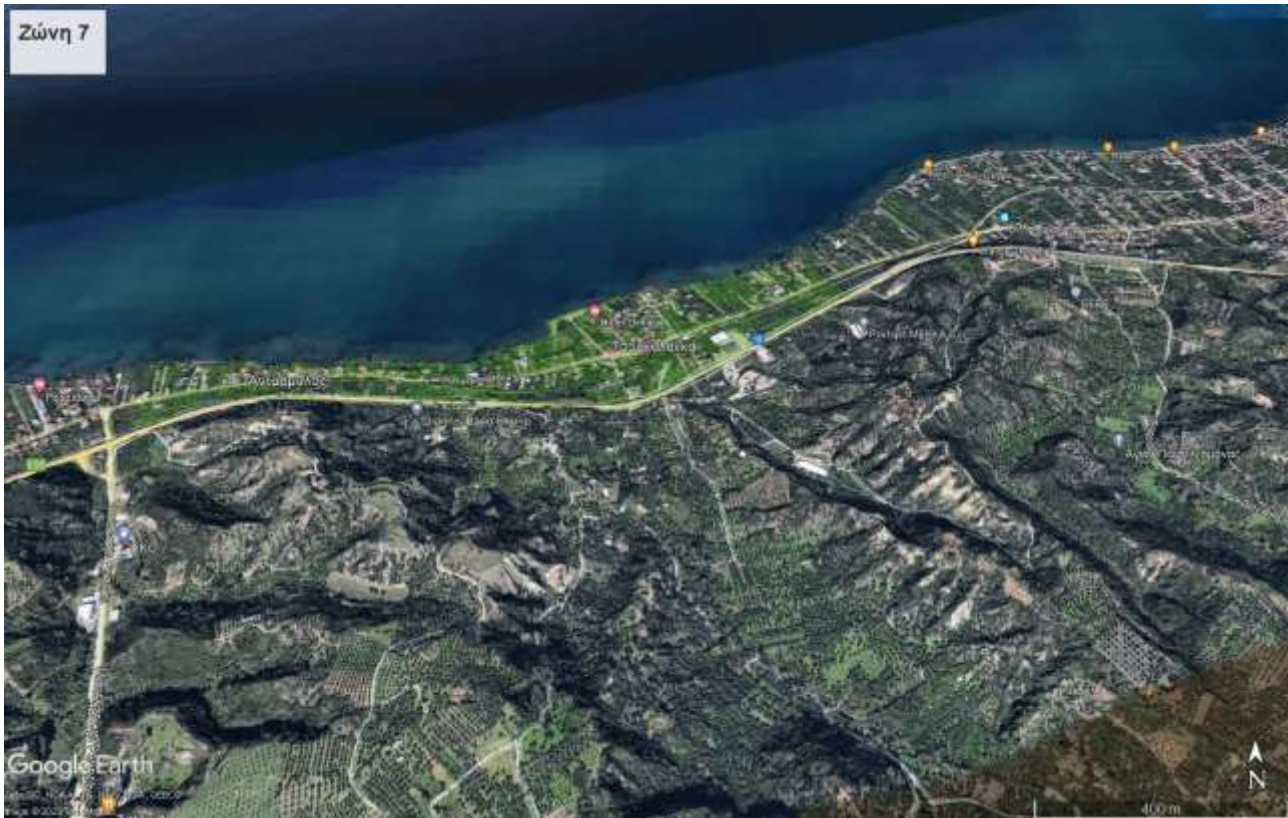
Εικόνα 5: Ζώνη 7 (Τσουκαλεΐικα)