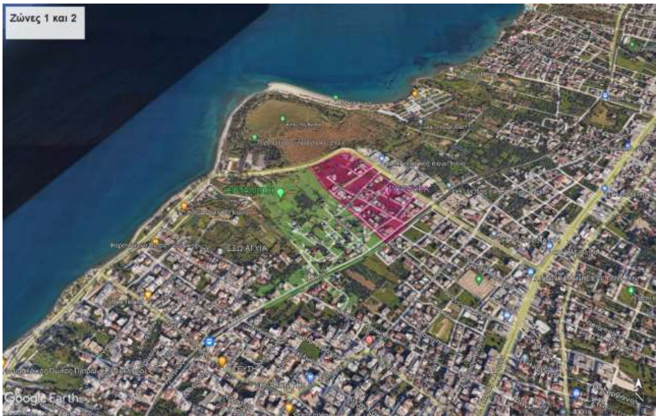
Εικόνα 2: Ζώνες 1 (Πορφύρα) και 2 (Εφταλιώτη)

Στις παρακάτω εικόνες απεικονίζεται η χωροθέτηση των 1.800 έξυπνων υδρομέτρων σε προτεινόμενες ζώνες. Επίσης περίπου το 10% των έξυπνων υδρομετρητών θα εγκατασταθούν, σε σημεία του κέντρου της πόλης της Πάτρας. Οι θέσεις του 10% των υδρομετρητών που θα εγκατασταθούν στο κέντρο της πόλης, θα είναι εναρμονισμένες με την εγκατάσταση του δικτύου LORA. Η επιλογή των ζωνών, ο αριθμός των έξυπνων υδρομέτρων ανά ζώνη και η τελική χωροθέτηση θα προκύψει κατά την εκπόνηση του Παραδοτέου Π1: Καταγραφή των σημείων τοποθέτησης νέων έξυπνων οικιακών υδρομέτρων από τον Ανάδοχο. Η επιλογή των θέσεων θα γίνει από την Αναθέτουσα Αρχή σε συνεργασία με την ΔΕΥΑΠ.