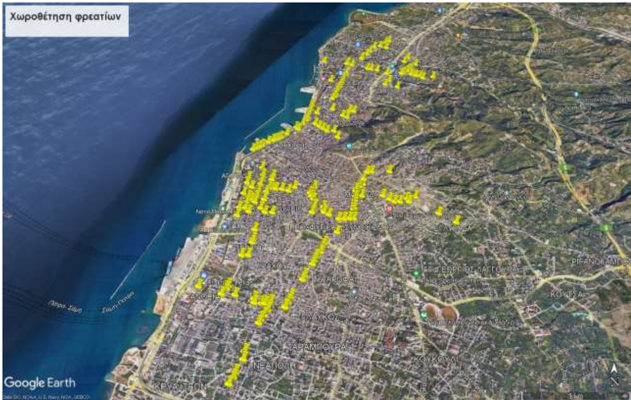
Εικόνα 1: Χωροθέτηση φρεατίων

Στην παρακάτω εικόνα φαίνεται η προτεινόμενη χωροθέτηση των φρεατίων εκτροπής παντοροϊκών αγωγών (συμπεριλαμβάνονται και οι εναλλακτικές θέσεις).