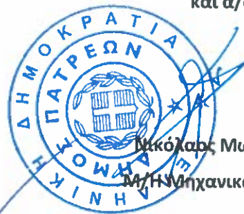
Νικόλαος Μωραΐτης Μ/Η Μηχανικός με Α β

ΑΝΤΙΔΗΜΑΡΧΟΣ ΠΡΟΓΡΑΜΜΑΤΙΣΜΟΥ, ΠΕΡΙΒΑΛΛΟΝΤΟΣ, ΕΝΕΡΓΕΙΑΣ & ΚΑΘΙΕΡΧΕΤΗΤΑΣ - ΑΝΑΚΥΚΛΩΣΗΣ