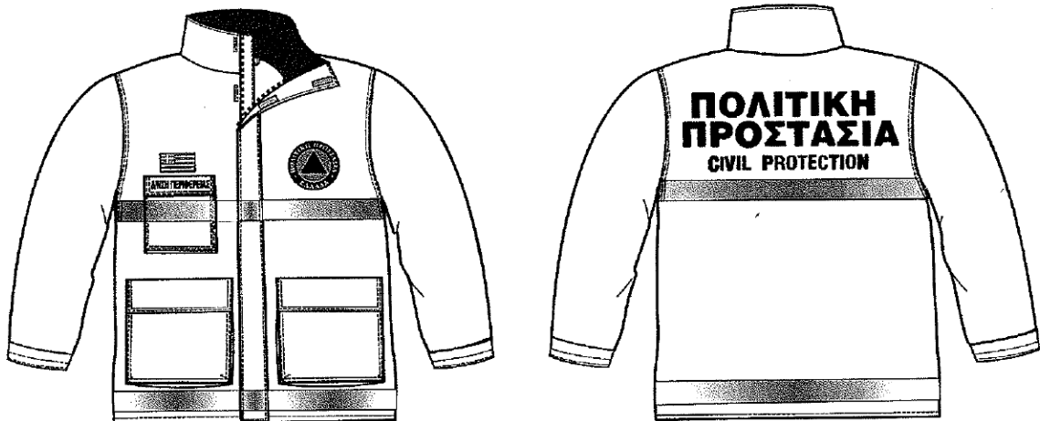
Εικόνα 1. Επιχειρησιακά μπουφάν Πολιτικής Προστασίας

Σύμφωνα με το 4678/22-11-2004 έγγραφο ΓΓΠΠ, τα επιχειρησιακά μπουφάν Πολιτικής Προστασίας θα πρέπει να έχουν την ακόλουθη μορφή: